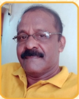
ഉത്സവ കൺവീനർ: രവി. എ. ജെ