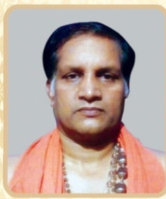
ബ്രഹ്മശ്രീ വാസുദേവ ഭട്ടതിരി (തന്ത്രി)