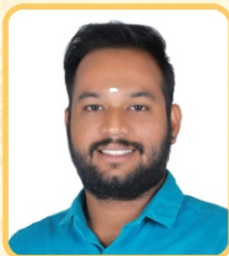
അവിൽ ശാസ്താംകോട്ട സെക്രട്ടറി